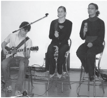
Schul(t)räume mit Musik.