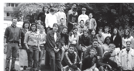
Besuch von den Patch Barracks.

Während des Wales-Austausches der Klassen 7 stand für die in Stuttgart gebliebenen Schülerinnen und Schüler die „English Week“ auf dem Programm, die von einem Organisationsteam von Eltern und Lehrern geplant und gestaltet wurde. Höhepunkte waren der Besuch amerikanischer Schüler von den Patch Barracks Vaihingen am Olga-Stift, ein Tag mit „English Table Games“, gemeinsames Kochen und ein Rugby-Training. Herzlichen Dank an alle beteiligten Eltern und Lehrkräfte!