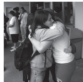
Freunde fürs Leben.

Rückmeldungen sind wichtig, denn nur durch sie können Verbesserungen erzielt werden – wenn es noch etwas zu verbessern gibt. Bei der Schulpartnerschaft des Olga-Stifts mit seinen beiden Partnerschulen in Oregon scheint das kaum noch möglich, wie zwei repräsentative Briefe zeigen: „Thank you so much for giving us such a wonderful experience with the young German students. They were very polite and delightful. We really enjoyed ourselves and hope the students did as well.“